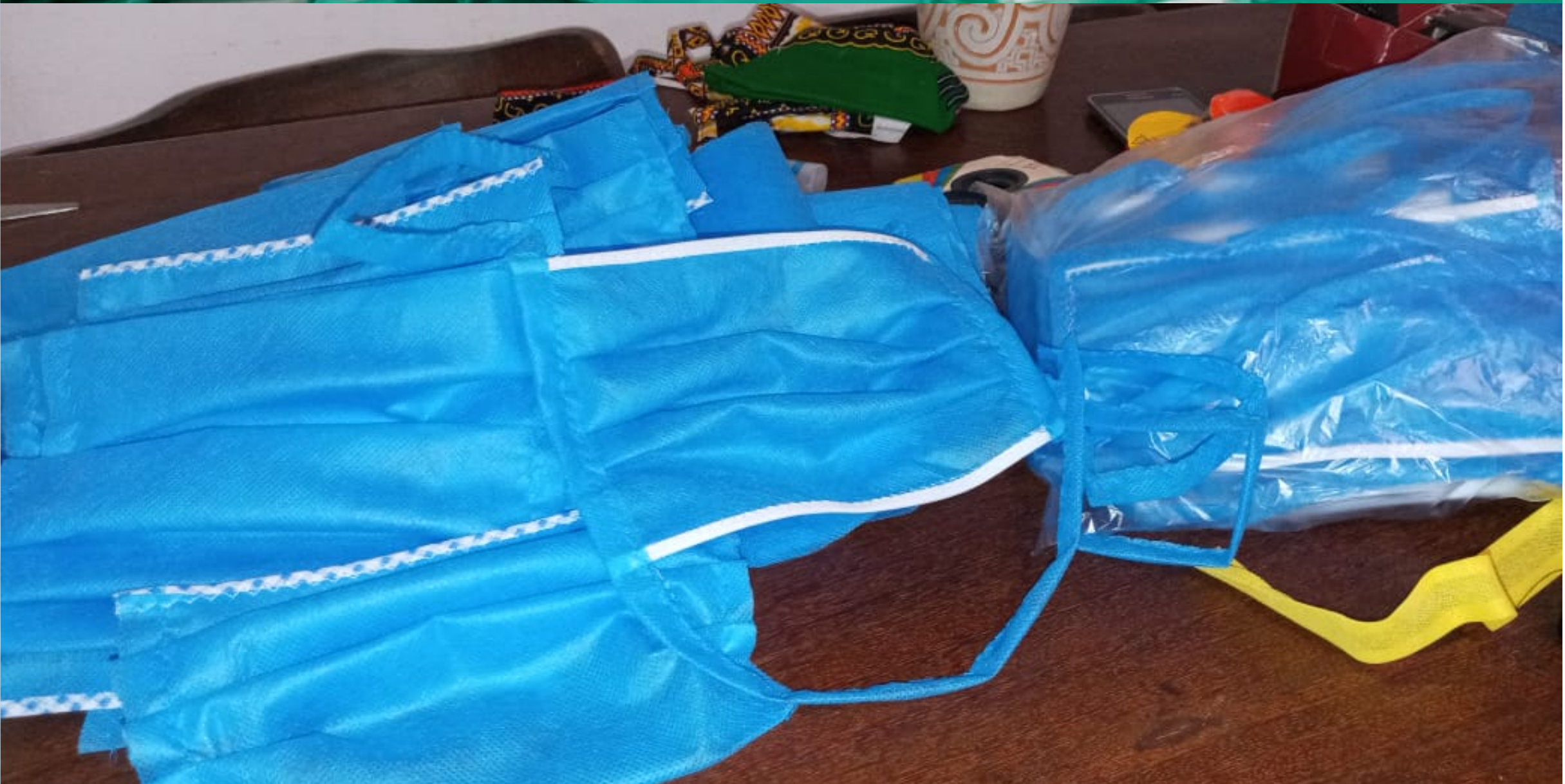
PAULETTE CAVALCANTI - 20200505